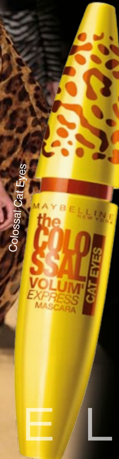
Colossal Cat Eyes