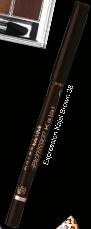
Expression Kajal Brown 38