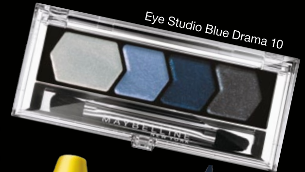
Eye Studio Blue Drama 10