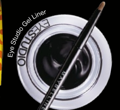
Eye Studio Gel Liner