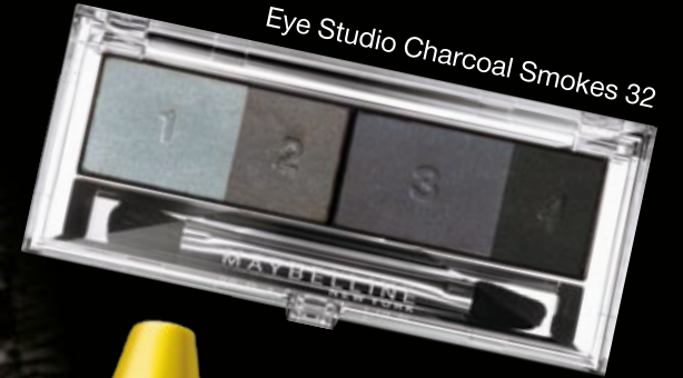
Eye Studio Charcoal Smokes 32