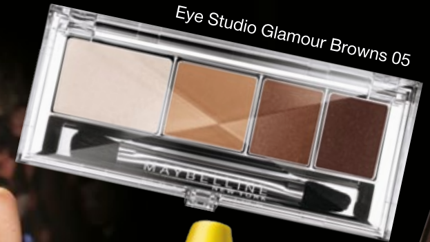
Eye Studio Glamour Browns 05